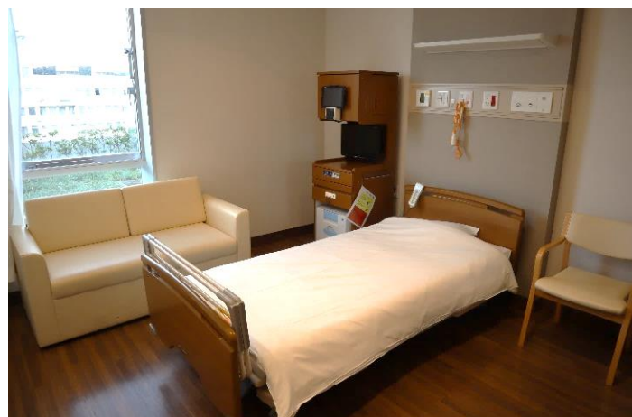
※個室は一例となります。全個室にトイレを完備しています。