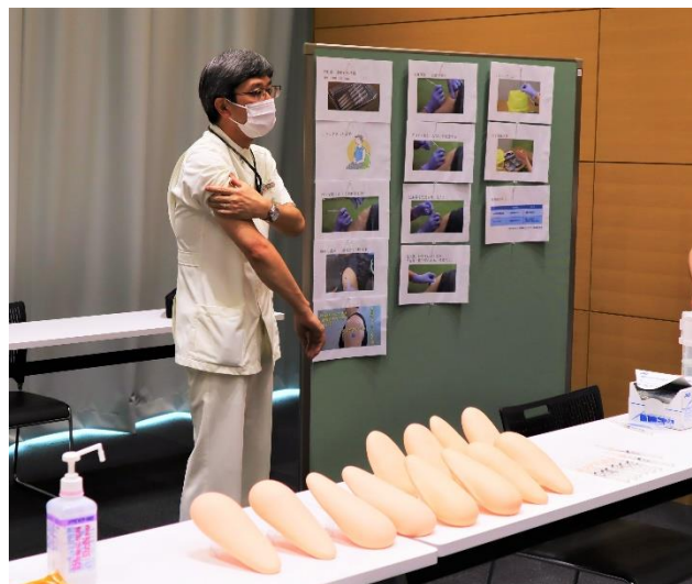
上腕三角筋のシリコン模型を使って、注射器に水を装填して実技研修をおこないました